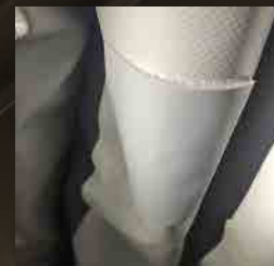
BAN-ZI AIDシリコンを使用した補修